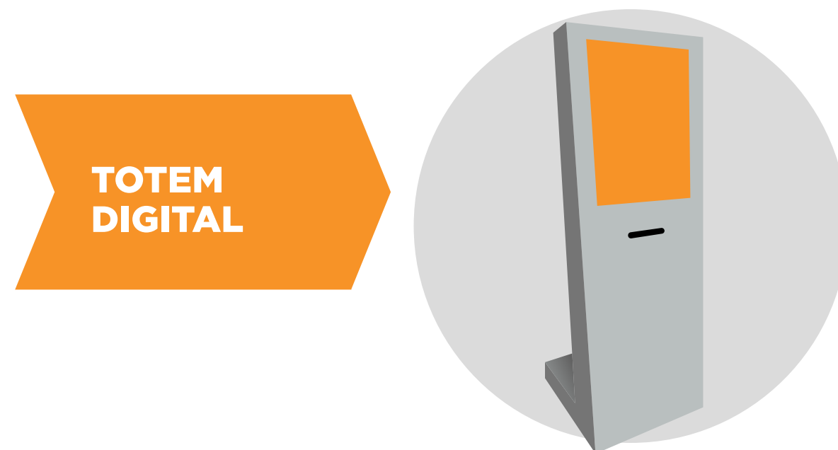
Imagem em modo randômico.

Arte inserida na home do site com link para site da empresa.